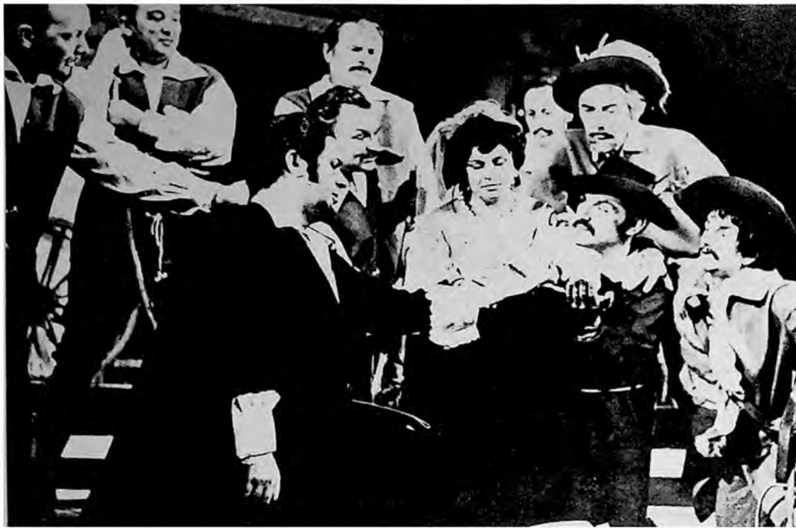
Scena iz predstave „Moć sudbine“ (La forza del destino) od Ducepe Verdija (G. Verdi) u izvođenju Opere Srpskog narodnog pozorišta, Novi Sad.