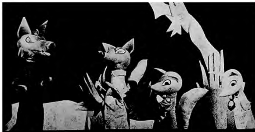
Scena iz predstave »Zeko, Zriko i jajce« u Pozorištu lutaka, Novi Sad.