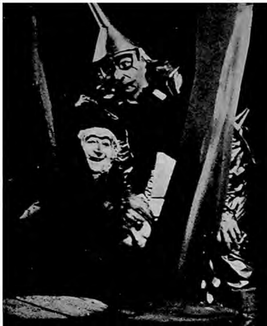
Scena iz predstave »Oz varázslója« u Dečjem pozorištu — Gyermekszínház, Subotica.