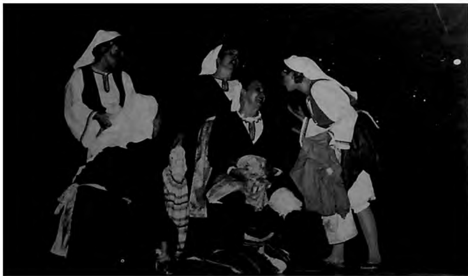
Prizor iz predstave „Gordana” Laze Kostića – Zorana Ratkovića – Vojislava Kostića, u izvođenju Narodnog pozorišta u Somboru