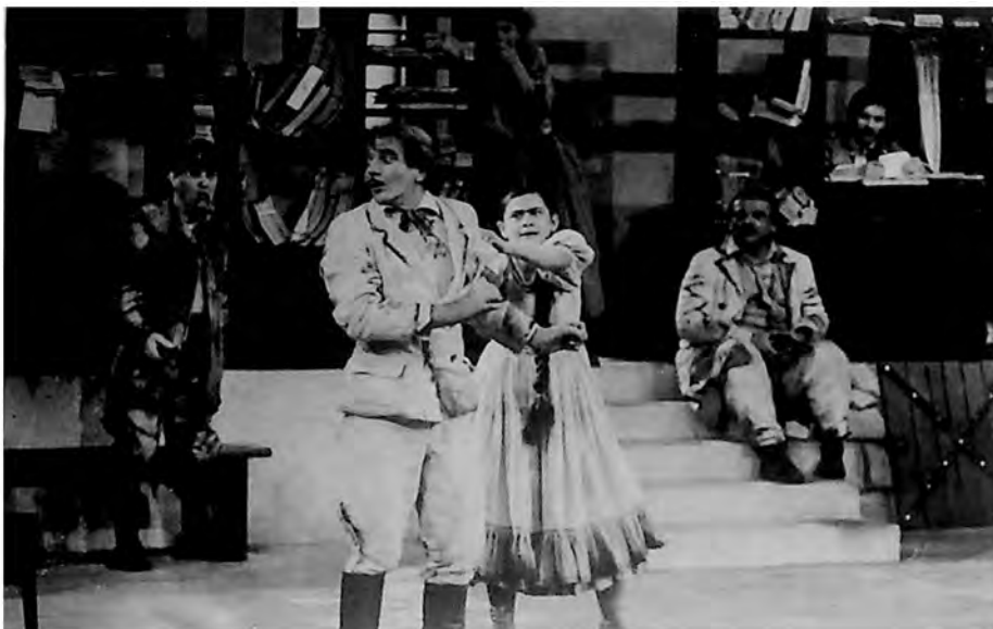
Prizori iz predstave „Sunnjivo lice“ Branislava Nušića, u izvođenju Drame Srpskog narodnog pozorišta u Novom Sadu