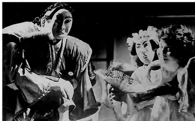
Prizor iz predstave „Asagao“ Miloša Vodičke, u izvođenju Dečjeg pozorišta – Gyermekszínház „Kurir Jovica“ u Subotici