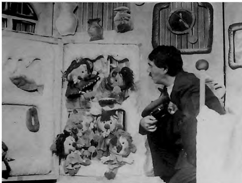
Prizor iz predstave „Princ Ledenko“ Emilije Mačkovič (po D. Rodariju), u izvođenju Pozorišta mladih u Novom Sadu