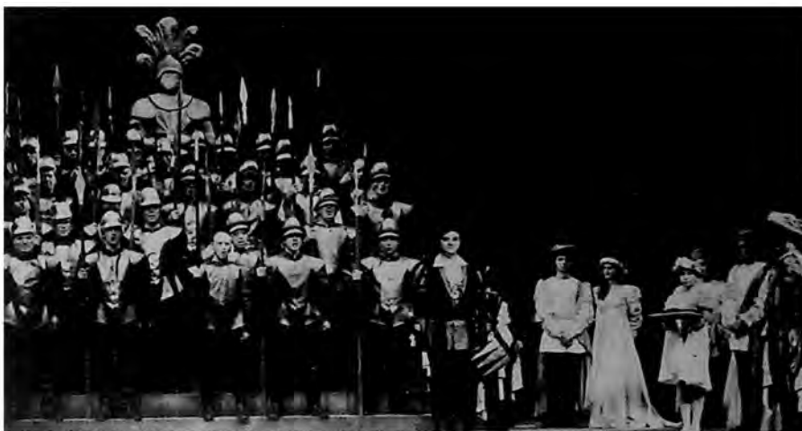
Prizori iz predstave „Faust“ Šarla Gunoa (Gounod), u izvođenju Opere Srpskog narodnog pozorišta u Novom Sadu