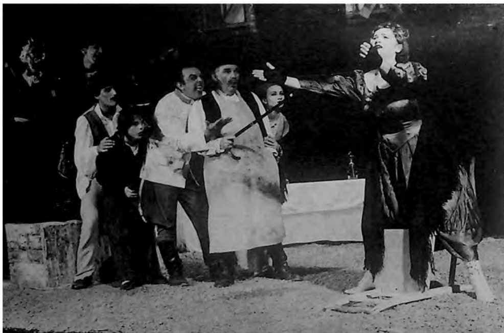
Prizor iz predstave „Pokondirena tikva“ Jovana Sterije Popovića, u izvođenju Narodnog pozorišta u Kikindi