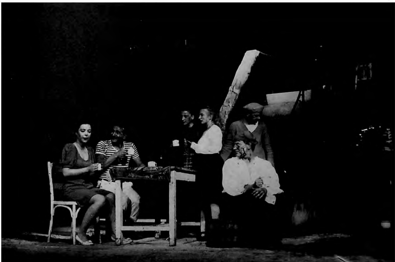
Prizor iz predstave „Kate Kapuralica“ Vlaha Stullija (Stulića), u izvođenju Narodnog pozorišta u Somboru