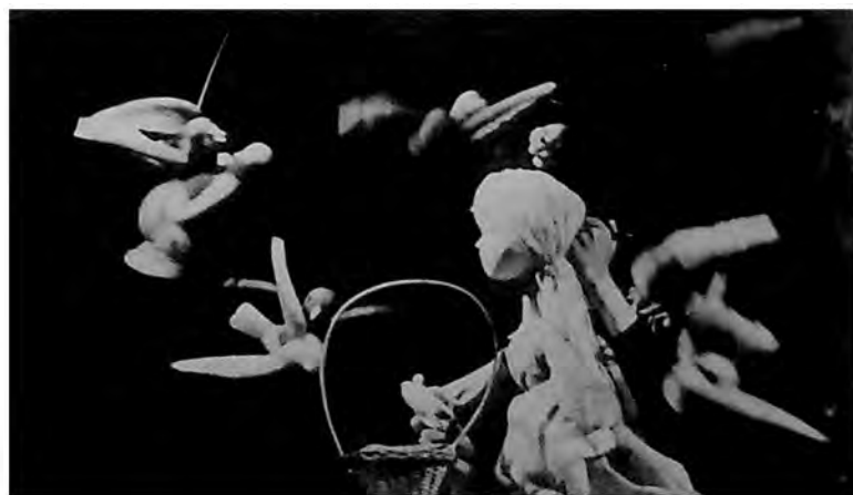
Prizor iz predstave „Hamupipőke“ – „Pepeljuga“ („Cendrillon“) Šarla Pjeroa (Piero), u izvođenju Dečjeg pozorišta – Gyermekszínház „Kurir Jovica“ u Subotici