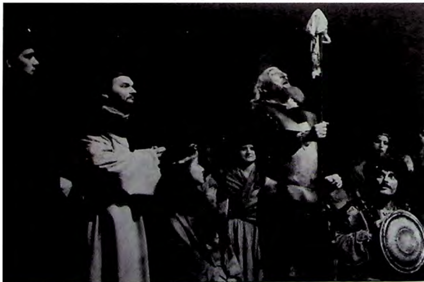
Prizor iz predstave „Čovek od la Manče“ („Man of la Mancha“) Miča Lija (Leigh), u izvođenju Opere Srpskog narodnog pozorišta u Novom Sadu