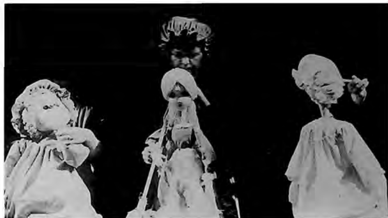
Prizor iz predstave „Pepeljuga“ („Cendrillon“) Šarla Pjeroa (Piero), u izvođenju Dečjeg pozorišta – Gyermekszínház „Kurir Jovica“ u Subotici