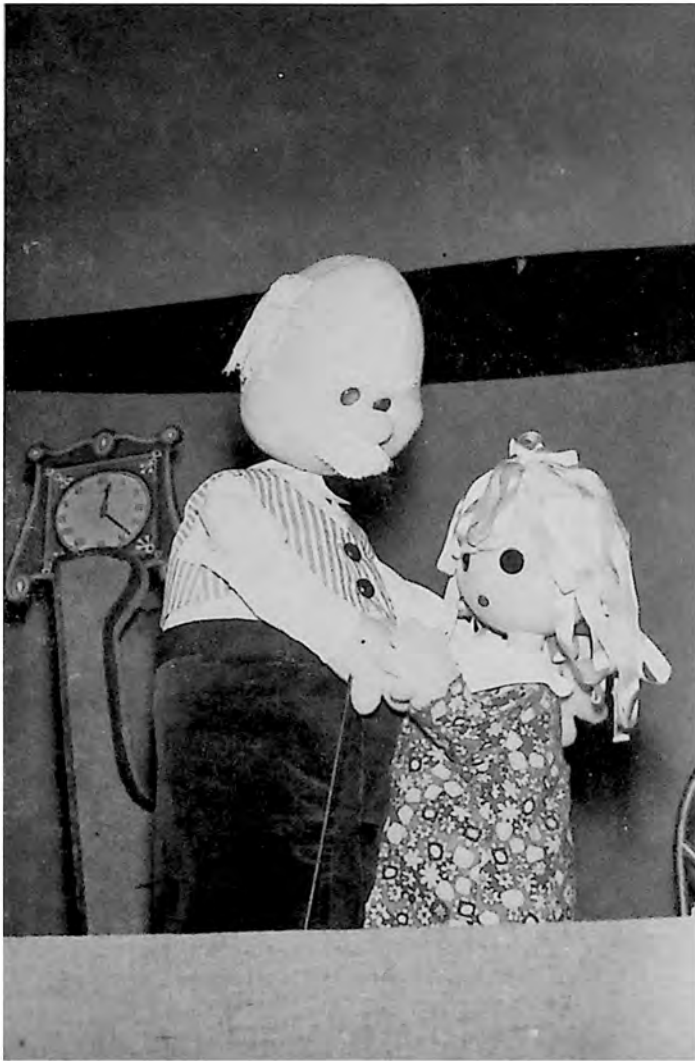
Scena iz predstave „Zarobljena princeza“ u izvođenju Pozorišta lutaka u Zrenjaninu.