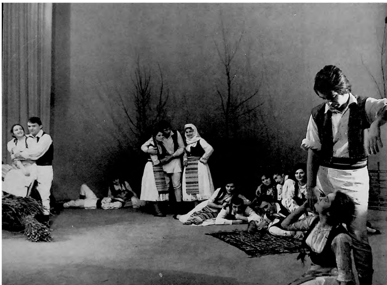
Scena iz predstave „Đilo“ od J. Veselinožića i D. Brzaka u izvođenju Narodnog pozorišta u Zrenjaninu.