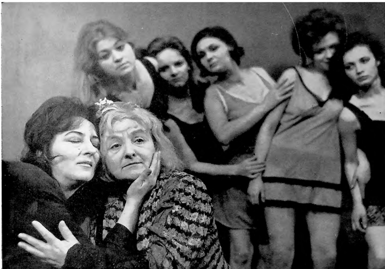
Scena iz predstave „Dom Bernarda Albe“ („Bernarda Albe casas“) od Lorke (Lorca) u izvođenju Narodnog pozorišta u Zrenjaninu.