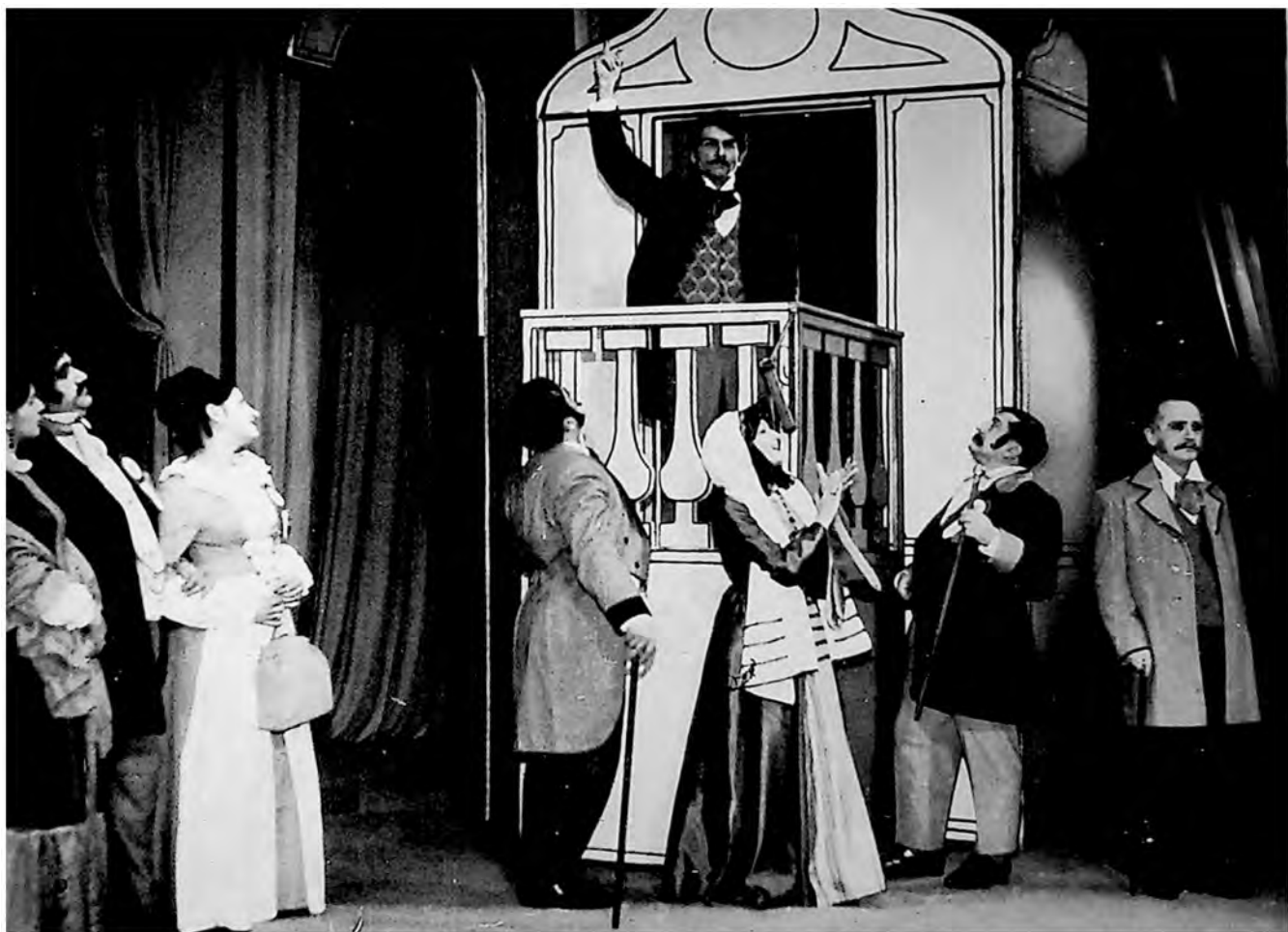
Scena iz predstave „Rodoljupci“ od J. St. Popovića u izvođenju Narodnog pozorišta „Sterija“ u Vršcu.