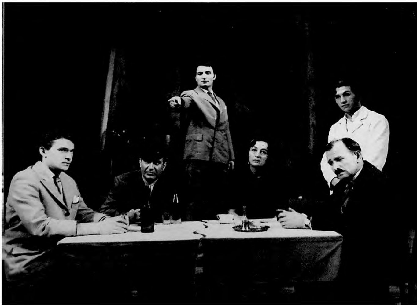
Scena iz predstave „Činije Slobodana Radni- ka“ od Oskara Daviča u izvođenju Narodnog pozorišta u Zrenjaninu.