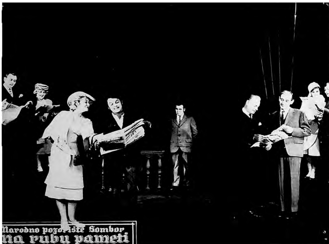
Scena iz predstave „Na rubu pameti“ od Miroslava Krležea u izvođenju Narodnog pozorišta u Somboru.