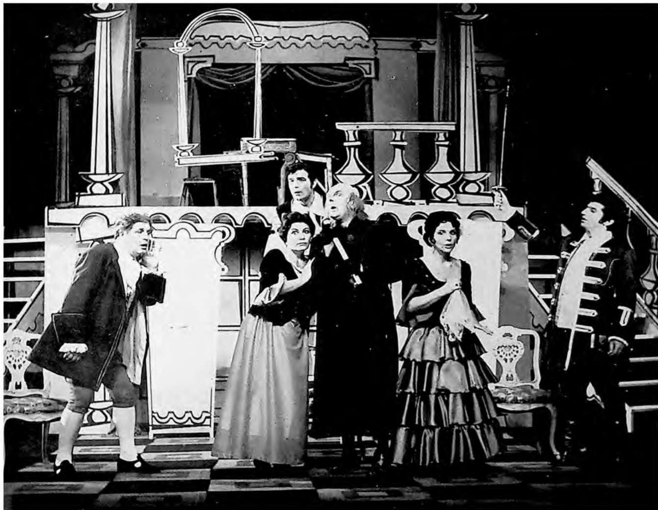
Scena iz predstave „Seviljski berberin“ („Il barbiere di Siviglia“) od Rosinija (Rossini) u izvođenju Opere Srpskog narodnog pozorišta u Novom Sadu.