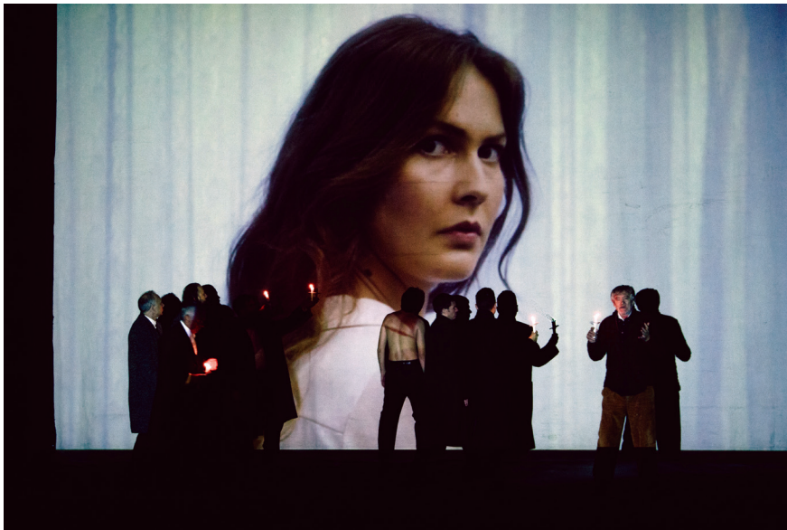
Сцена из представе Травничка хроника , у драматизацији и режији Никите Миливојевића, према истоименом делу Иве Андрића, у копродукцији са Српским народним позориштем, Нови Сад