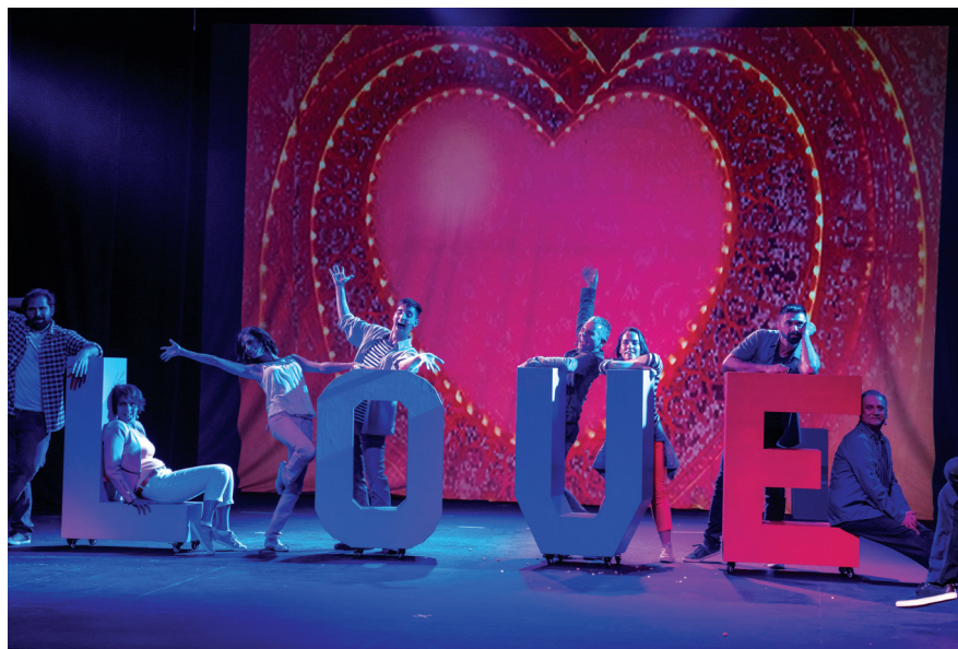
Сцена из представе Заљубљивање , ауторски пројекат Оље Ђорђевић