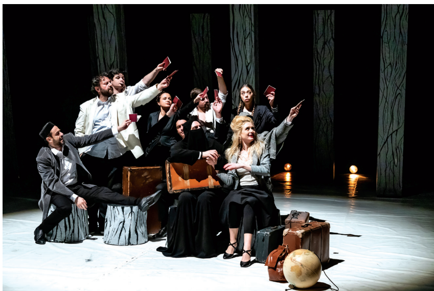
Сцена из представе Јованча на путу око света Бранислава Нушића, у режији Золтана Пушкаша